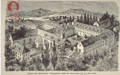
Monastère des Ursulines de Québec / Carte postale (1860)