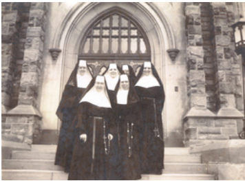
Les Soeurs Ursulines devant "Ursuline Hall" / (1936)