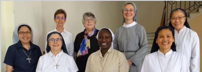
Ursulines Union Romaine France Belgique Espagne / (2022)

Les soeurs Ursulines, aussi connus sous le nom de l'Ordre de Sainte-Ursule, sont un ordre religieux catholique romaine fondé en Italie par Angèle Mérici, une femme religieuse, en 1535 avec le but d'éduquer les femmes. Elles portent le nom de Sainte-Ursule , le saint de l'éducation catholique, des étudiants, et des enseignants. Au début, les Ursulines comptaient que 28 soeurs, mais aujourd'hui, il y en a des milliers de membres toute autour du monde.