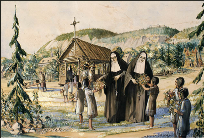
Premières religieuses ursulines avec des étudiantes autochtones, à Québec / Lawrence R. Batchelor (1931)

Elles ont toutefois eu le plus de succès en éduquant les jeunes femmes Canadiennes-françaises - enseignant non-seulement la doctrine chrétienne mais aussi la lecture et l'écriture, l'art, l'arithmétique, le travail domestique, et plus tard, les sciences. Entre 1639 et 1686, elles ont enseignés 514 filles franco-canadiennes.