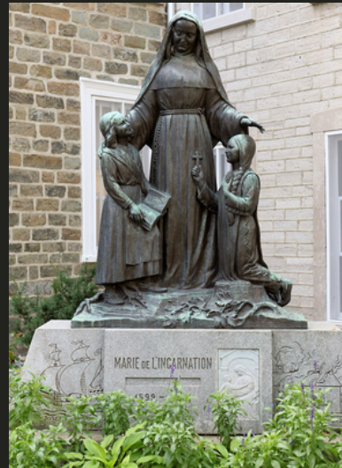
Monument Marie-de-l'Incarnation, Inaugurée en 1942 et localisée sur la Rue Donnacona à Québec./ Émile Brunet, Wikipedia Commons

En 1668 , Marie de l'Incarnation a avoué que ses efforts de "francisation" n'ont pas été efficaces. C'était à ce point là que les Ursulines se sont focalisés entièrement à l'éducation des filles colons.