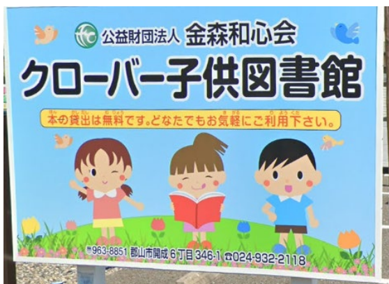
福島県郡山市の図書館にあるサイン