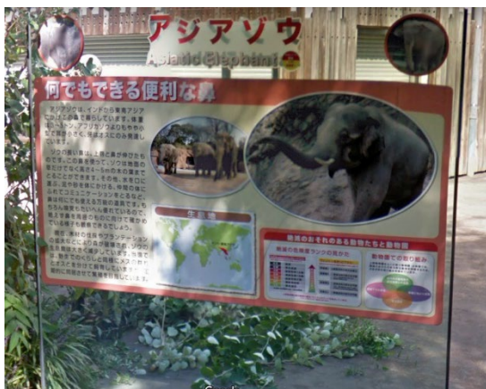
東京台東区の動物園にあるサイン