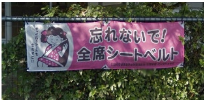
京都の保育園の隣にあるサイン