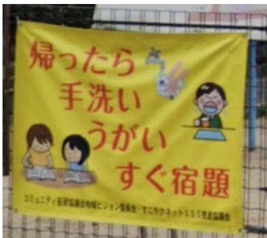
兵庫県伊丹市の子供遊園地にあるサイン